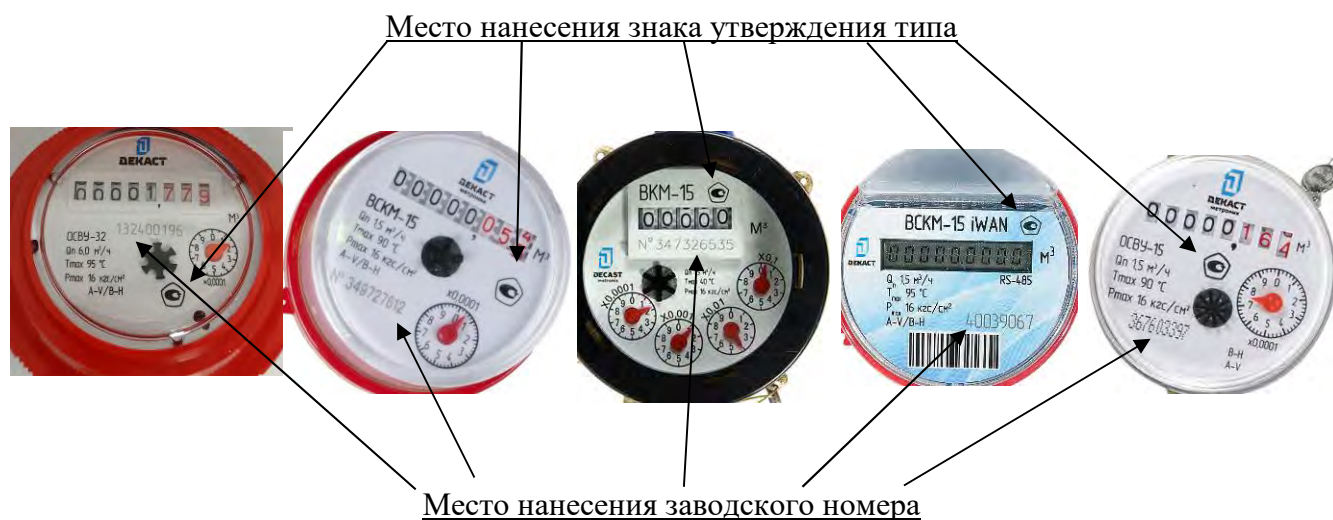
Место нанесения знака утверждения типа