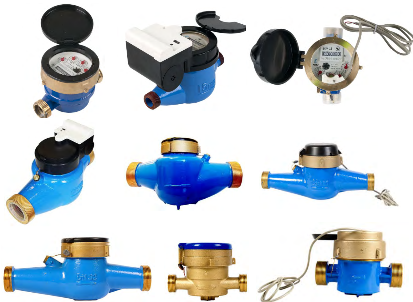
Рисунок 3- Общий вид счетчиков холодной и горячей воды крыльчатых Декаст модификации ВКМ и ВКМ М

Схема пломбировки от несанкционированного доступа, обозначение места нанесения знака поверки представлены на рисунке 4.