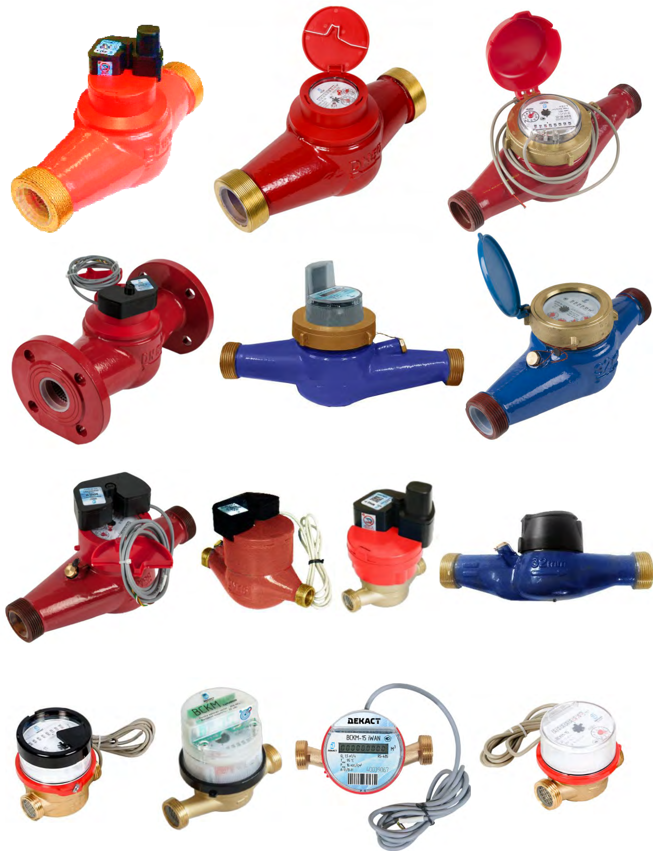
Рисунок 2- Общий вид счетчиков холодной и горячей воды крыльчатых Декаст модификации ВСКМ 90 и ВСКМ 90Х