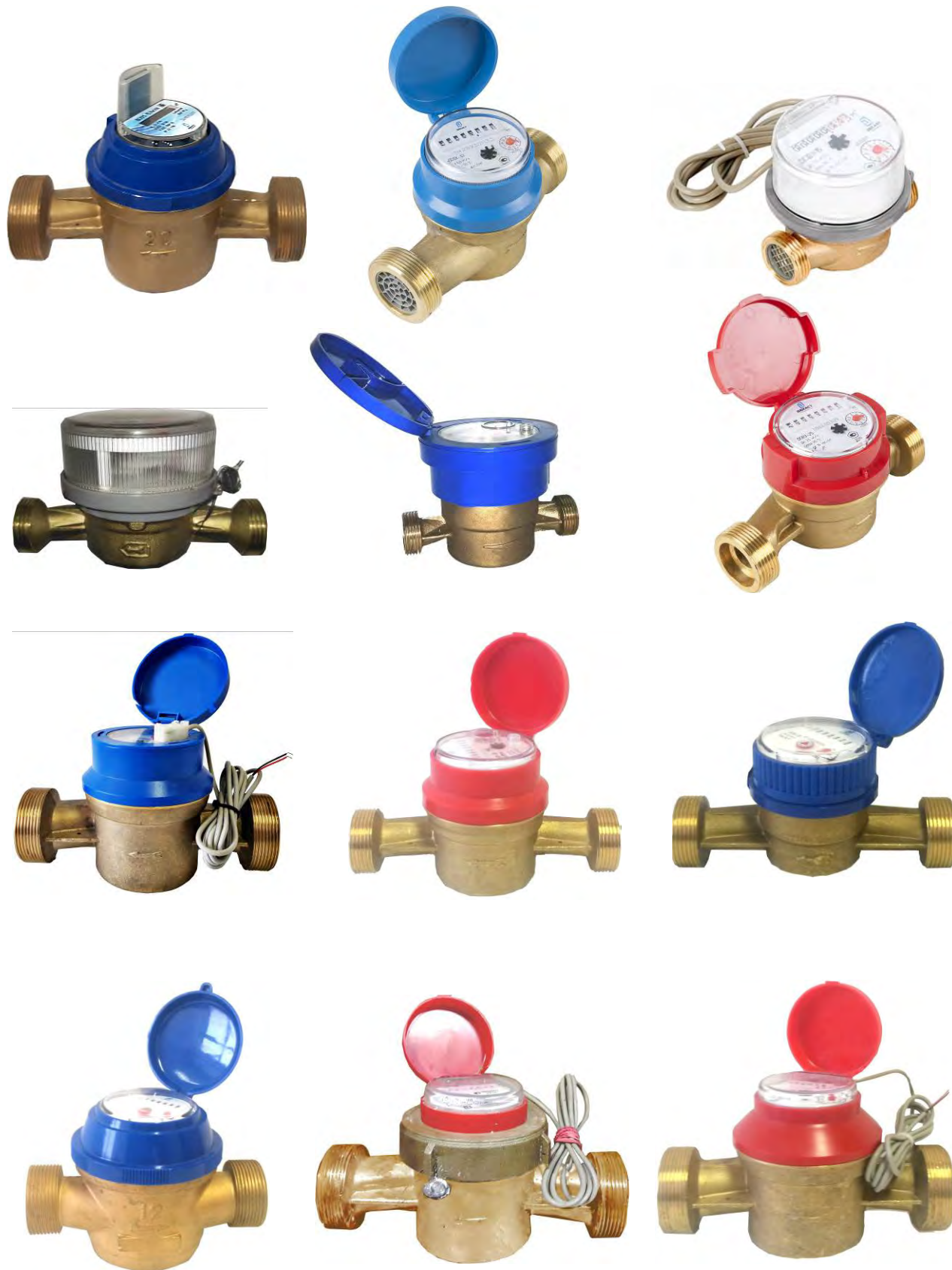
Рисунок 1- Общий вид счетчиков холодной и горячей воды крыльчатых Декаст модификации ОСВХ и ОСВУ

Общий вид счетчиков представлен на рисунках 1-3.