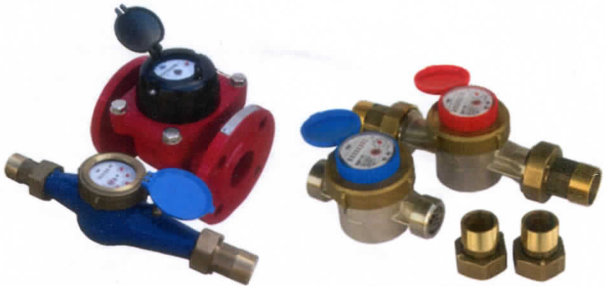
Рисунок 1 – Общий вид счетчиков холодной воды крыльчатых ВДХ-М, ВДХ-ИМ, турбинных ВДТХ-М, ВДТХ-ИМ, холодной и горячей воды крыльчатых ВДГ-М, ВДГ-ИМ, турбинных ВДТГ-М, ВДТГ-ИМ

Пломбирование от несанкционированного доступа счетчиков холодной воды крыльчатых ВДХ-М, ВДХ-ИМ, турбинных ВДТХ-М, ВДТХ-ИМ, холодной и горячей воды крыльчатых ВДГ-М, ВДГ-ИМ, турбинных ВДТГ-М, ВДТГ-ИМ осуществляется нанесением знака поверки давлением на свинцовую (пластмассовую) пломбу. Пломба навешивается на внешнюю боковую сторону счетчика холодной воды крыльчатого ВДХ-М, ВДХ-ИМ, турбинного ВДТХ-М, ВДТХ-ИМ, холодной и горячей воды крыльчатого ВДГ-М, ВДГ-ИМ, турбинного ВДТГ-М, ВДТГ-ИМ посредством проволоки, проведенной через специальные отверстия, соединяющие измерительную камеру и счетный механизм. Место пломбировки счетчиков холодной воды крыльчатых ВДХ-М, ВДХ-ИМ, турбинных ВДТХ-М, ВДТХ-ИМ, холодной и горячей воды крыльчатых ВДГ-М, ВДГ-ИМ, турбинных ВДТГ-М, ВДТГ-ИМ представлено на рисунке 2.