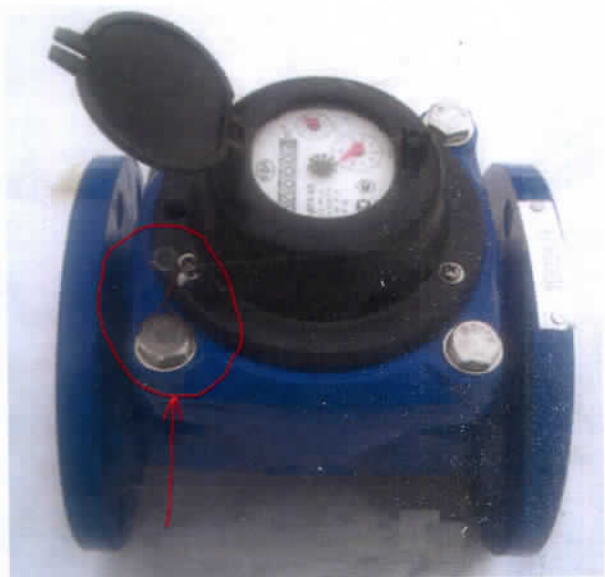
Рисунок 2 – Схема пломбировки от несанкционированного доступа, обозначение места нанесения знака поверки счетчиков холодной воды крыльчатых ВДХ-М, ВДХ-ИМ, турбинных ВДТХ-М, ВДТХ-ИМ, холодной и горячей воды крыльчатых ВДГ-М, ВДГ-ИМ, турбинных ВДТГ-М, ВДТГ-ИМ